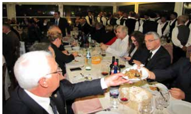
Večer se je nadaljeval pozno v noč

Po zajtrku v hotelski restavraciji smo odšli pred ho-