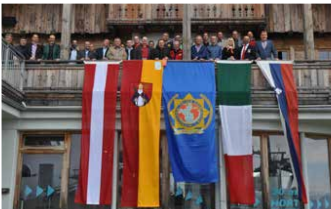
Skupinski posnetek udeležencev

V letu 2017 bo IPA RK Gorenjske organizator srečanja županov, vodstvenih delavcev Policije in IPE.